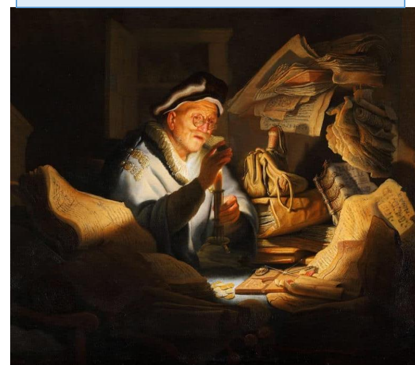
Parabole de l'homme riche Rembrandt, 1627

Le 3 août 2025 18 e Dimanche du Temps Ordinaire C